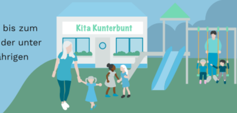
Illustration: Marco Agosta, Asja Beckmann

Die Bremer Politik will in der Stadt Bremen bis zum Jahr 2023 Betreuungsplätze für 60 Prozent der unter Dreijährigen anbieten. Die Drei- bis Sechsjährigen sollen zu 100 Prozent versorgt werden.